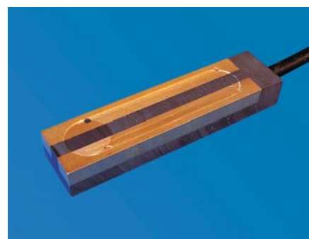
ETOR - 55